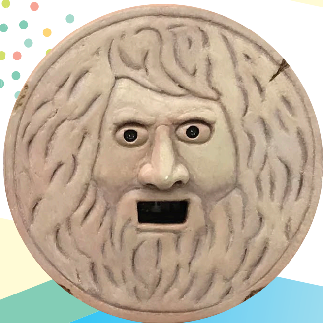
真実の口型手指消毒