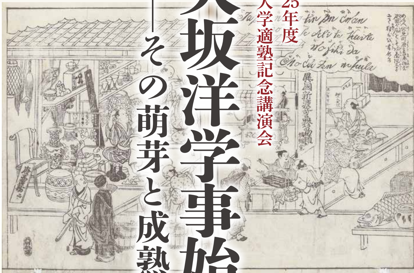
『摂津名所図会』より伏見町屋の図