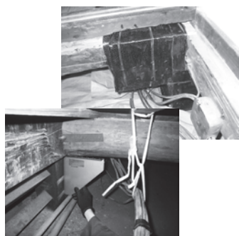
炭素繊維により部材を保護(上)し、 仕口ダンパー(下)を設置