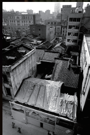
昭和の改修時（1976～1981）