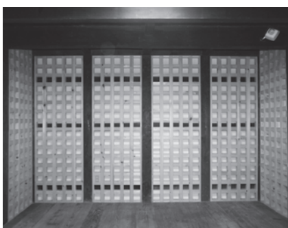
面格子壁の設置(蔵) (2014年3月)