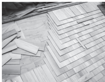
屋根の土居葺き (2014年2月)