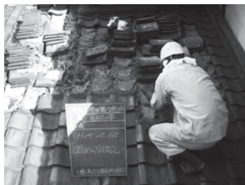
瓦めくり(葺き土の撤去) (2013年12月)