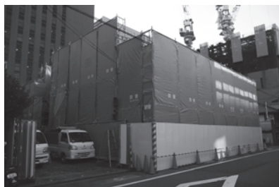
工事足場設置 (2013年11月)