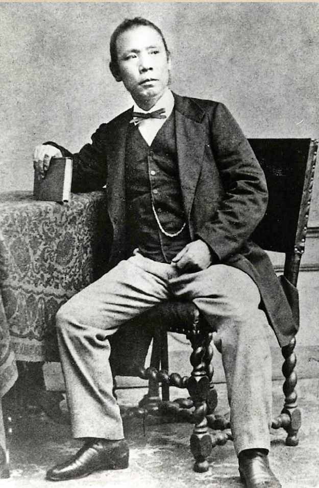
佐野常民肖像(日本赤十字社所蔵)