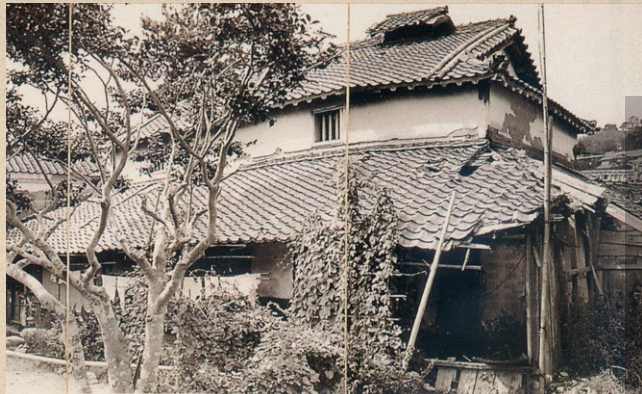
八重の生家・億川家住宅(大阪大学適塾記念センター所蔵)